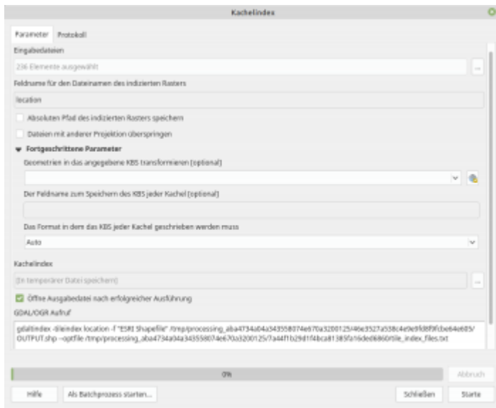
Abb. X: Die Funktion „Kachelindex erzeugen“ aus der GDAL bibliothek

In der Regel ist es gar nicht nötig, alle Kacheln zu laden oder zu einem Bild zusammen zu fügen. Meistens genügt es uns, die Bilder zu laden, welche für die Ausdehnung unseren Projekts von Relevanz sind . Hierzu müsste man aber wissen, welches Bild (Dateiname) an welcher Stelle sich befindet (und das geht aus dem Dateinamen oft nicht hervor!). Hier hilft ein Kachel-Index! Diesen erzeugen wir mit dem Befehl Kachel - Index erzeugen oder über das Menü Raster -> Verschiedenes -> Kachel Index.... Es wird eine Shapedatei erstellt, in welcher für jede Bildkachel ein Polygon (Rechteck) erzeugt wird. In den Attributen der einzelnen Kachel-Polygone finden wir dann den Pfad und Dateinamen zur ursprünglichen Raster-Kachel (siehe Abb. X).